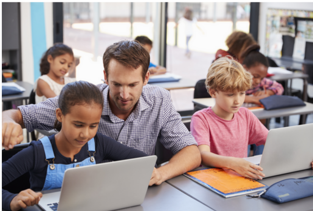
Usages du numérique en éducation