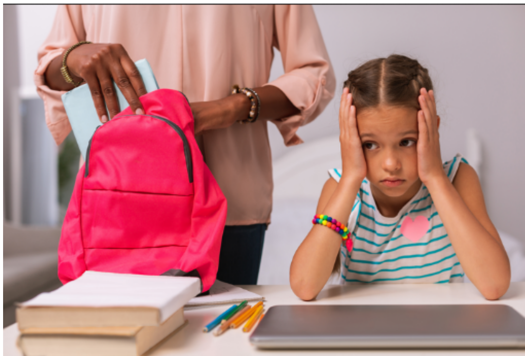
Punitions, sanctions et justice à l'école