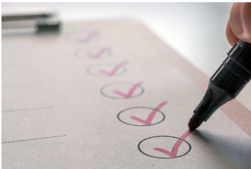
Pilotage de l'évaluation en établissement