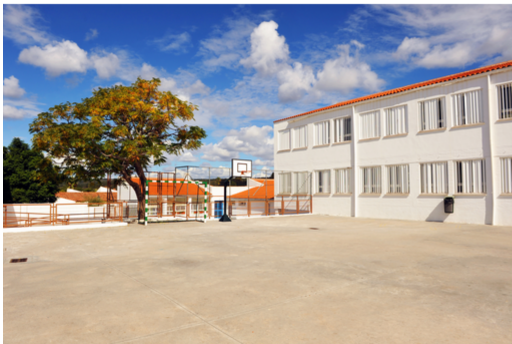
profit de la communauté scolaire Penser les espaces au