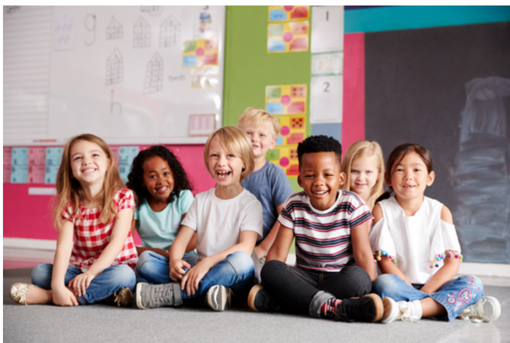
Mixité sociale et égalité des chances