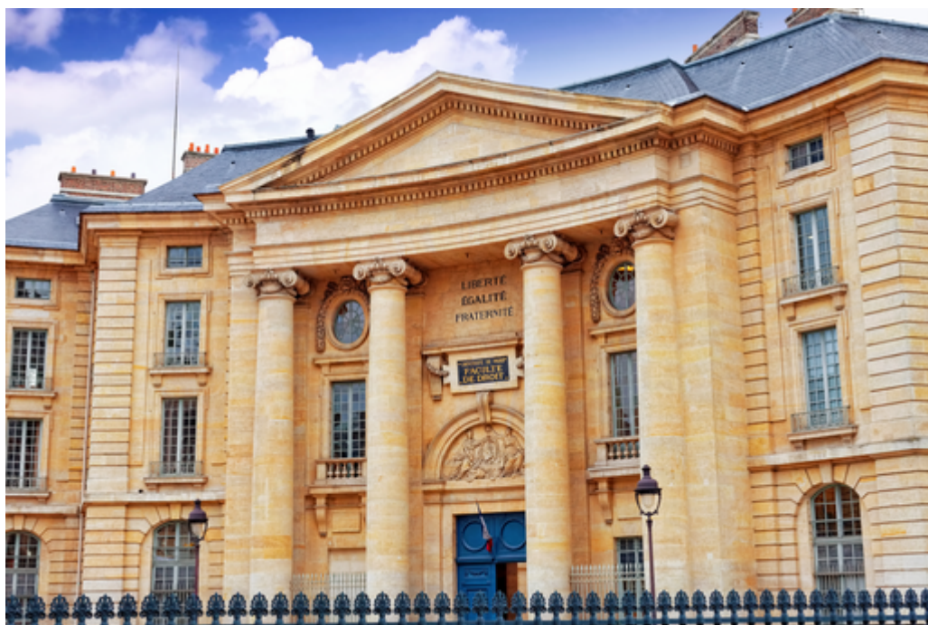
Comprendre le positionnement des universités et ...