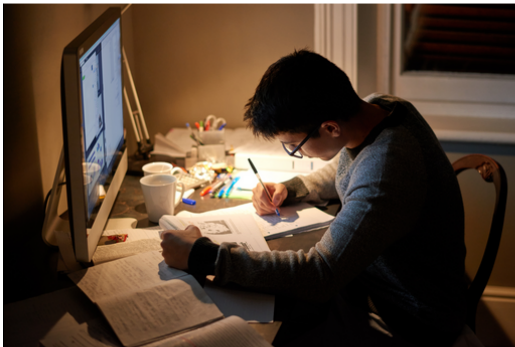
Travail personnel et réussite de l'élève