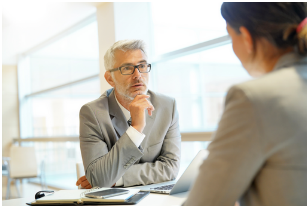
L'accompagnement professionnel des personnels des EPLE