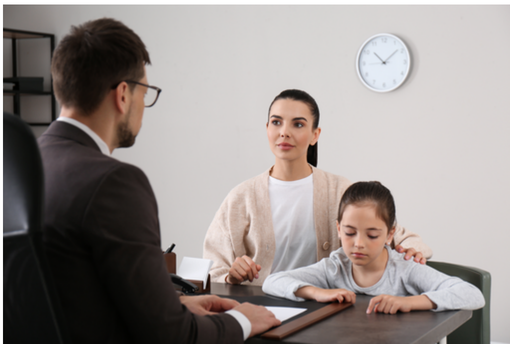
Alliances éducatives et co-éducation